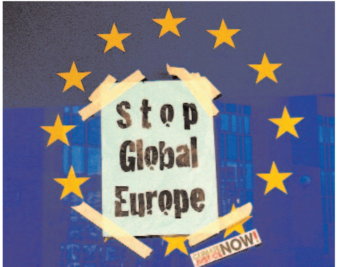
JUSTICIA CLIMÁTICA. La Presidencia española se enmarca en plena crisis económica, energética y climática.

La gran medida contra la crisis consiste en la puesta en marcha de organismos para regular los mercados financieros, aunque carece todavía de concreción y no parece que esté diseñada más que para contro-