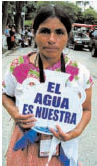
AGUA. Los TLC de la UE incluyen la privatización de servicios públicos básicos.

La presencia de delegaciones de América y Europa requiere del apoyo de todas y de todos. Se está creando una red de casas solidarias. Y se ha organizado un equipo para resolver las incidencias que puedan surgir en