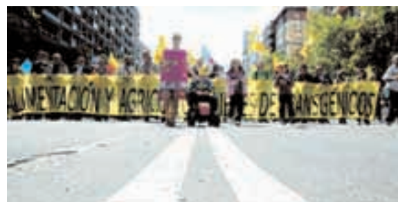
ZARAGOZA, ABRIL 2009. Manifestación contra los transgénicos.

El encuentro estatal "Activ@s contra la crisis" convoca una jornada de lucha y movilización, impulsando, entre otras acciones, marchas contra el paro, la crisis y el racismo, desde diferentes puntos de la península rumbo a Madrid.